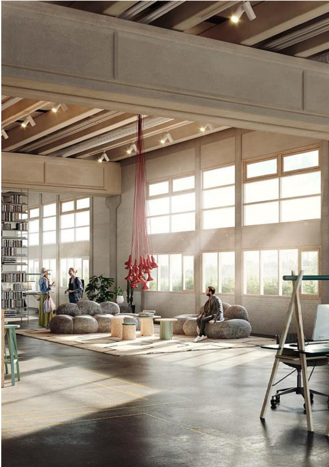
Tredje våningen, illustrationsexempel.