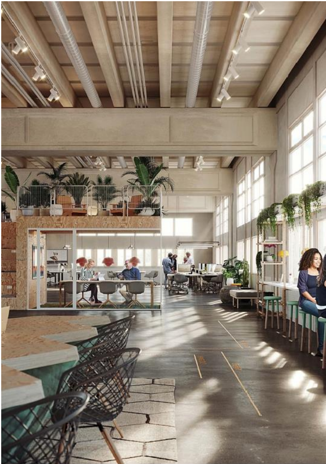
Tredje våningen, illustrationsexempel.